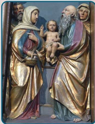
Gaukirche, Paderborn