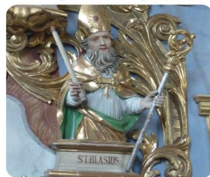
Pfarrkirche Niederolang

Der heilige Blasius (Festtag: 3. Februar) war ein Bischof, der auch in schweren Zeiten Gott die Treue hielt und Menschen aus ihrer Not errettet hat. Mit dem Blasiussegen hoffen wir, dass auch wir in Notzeiten Licht sehen. Licht, das uns daran erinnert, dass wir auch dann im Licht Jesu sind, wenn wir krank werden oder Sorgen haben.