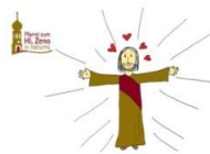
AG Familiengottesdienst der Pfarre Naturns

18.00 Uhr in der Pfarrkirche Naturns einladen. Die vorderen Plätze sind für dich reserviert.